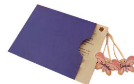
Corte de Semicírculo