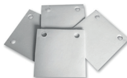
Perforación de 6mm