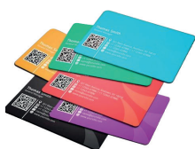
Diferentes Radios de corte